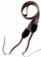
Szelki do mier- nika (typ M-1)