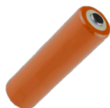
4x bateria LR6 1,5 V