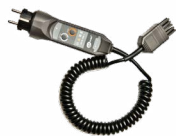
Adapter WS-01 wyzwalający pomiar (wtyk UNI-Schuko)