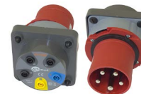
Adapter gniazd trójfazowych 63 A