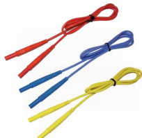
Przewód 1,2 m (wtyki bananowe) czerwony / nie- bieski / żółty