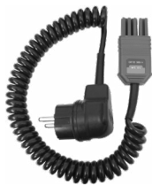
Adapter WS-05 (wtyk kątowy UNI-Schuko)