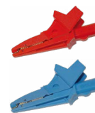
Krokodylek 1 kV 20 A czerwony / niebieski