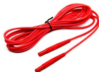
Przewód do pomiaru pętli zwarcia (wtyki bananowe) 5 m / 10 m / 20 m