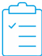
Świadectwo wzorco- wania z akredytacją