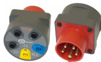
Adapter gniazd trój- fazowych 16A / 32A