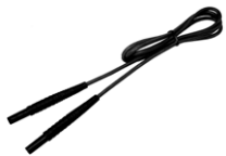
Przewód 2,2 m zakończony wtykami bananowymi czarny