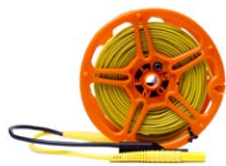
Przewód 50 m na szpuli do pomiaru uziemień (wtyki bananowe, ekranowany) żółty