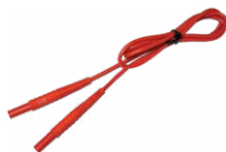
Przewód 1,2 m zakończony wtykami bananowymi czerwony