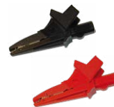
Krokodylek 1 kV 20 A czarny / czerwony