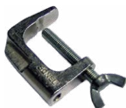
Zacisk imadłkowy (wtyk bananowy)