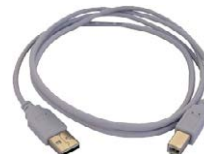
Przewód do transmisji danych USB