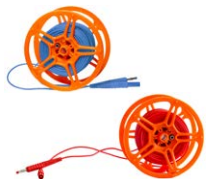
Przewód 25 m na szpuli do pomiaru uziemień (wtyki bananowe) niebieski / czerwony