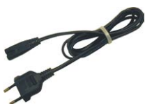
Przewód do zasilania 230 V (wtyk IEC C7)