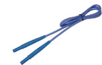
Przewód 1,2 m niebieski 1 kV (wtyki bananowe)