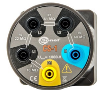
Symulator ka- bla CS-1