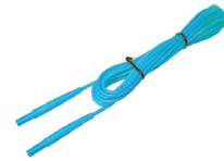
Przewód 5 m niebieski 1 kV (wtyki bananowe)