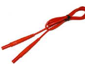
Przewód 1,2 m czerwony 1 kV (wtyki bananowe)